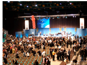
... als Event- / Kongress-Präsentationslösung ...