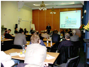
... im Vortrag, im Training, in der Schulung ...