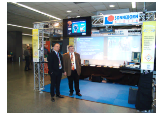
... im Verkauf und in der Beratung, am Messe-Stand, im Touch-Terminal-Einsatz u.v.m. ...