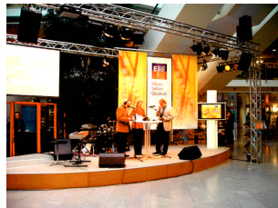
... als Sendeablauf-Steuerung auf Live-Bühne, Schwerpunkt Videofilme- und Präsentationen