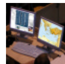
„On the Fly“-Presenter

Stressfrei, sicher schnell, und flexibel, alle Medien im Zugriff.