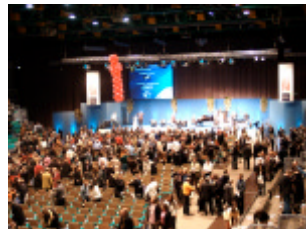
... als Event- / Kongress-Präsentationslösung ...