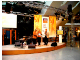
... als Sendeablauf-Steuerung auf Live-Bühne, Schwerpunkt Videofilme- und Präsentationen...