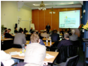
... im Vortrag, im Training, in der Schulung ...