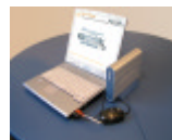
Plug & Play MediaDrive

PARTOUT® ist nicht nur nützlich – PARTOUT® macht erfolgreich, ohne Mehraufwand für die Mitarbeiter zu verursachen. Dank einer Reihe von Alleinstellungsmerkmalen können viele Aufgaben „wie aus dem Stehgreif“ erledigt werden.