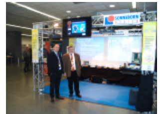
... im Verkauf und in der Beratung, am Messe-Stand, im Touch-Terminal-Einsatz u.v.m. ...